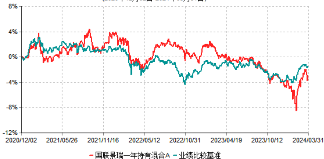
国联景瑞一年持有混合A累计净值增长率与业绩比较基准收益率历史走势对比图 (2020年12月02日-2024年03月31日)