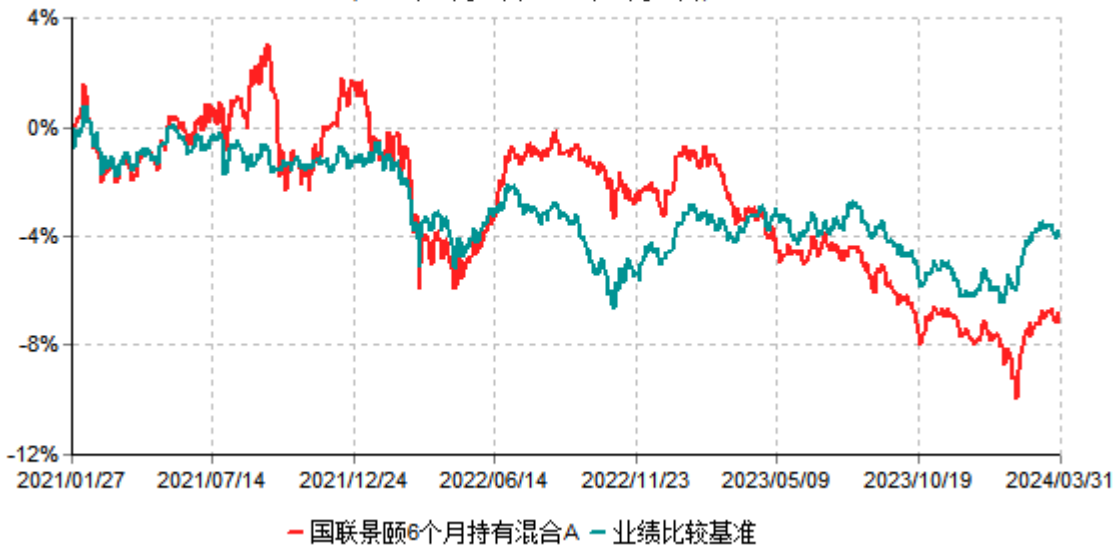
国联景颐6个月持有混合A累计净值增长率与业绩比较基准收益率历史走势对比图 (2021年01月27日-2024年03月31日)