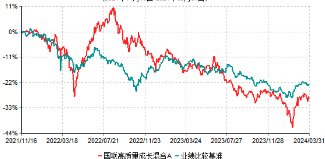
国联高质量成长混合A累计净值增长率与业绩比较基准收益率历史走势对比图 (2021年11月16日-2024年03月31日)