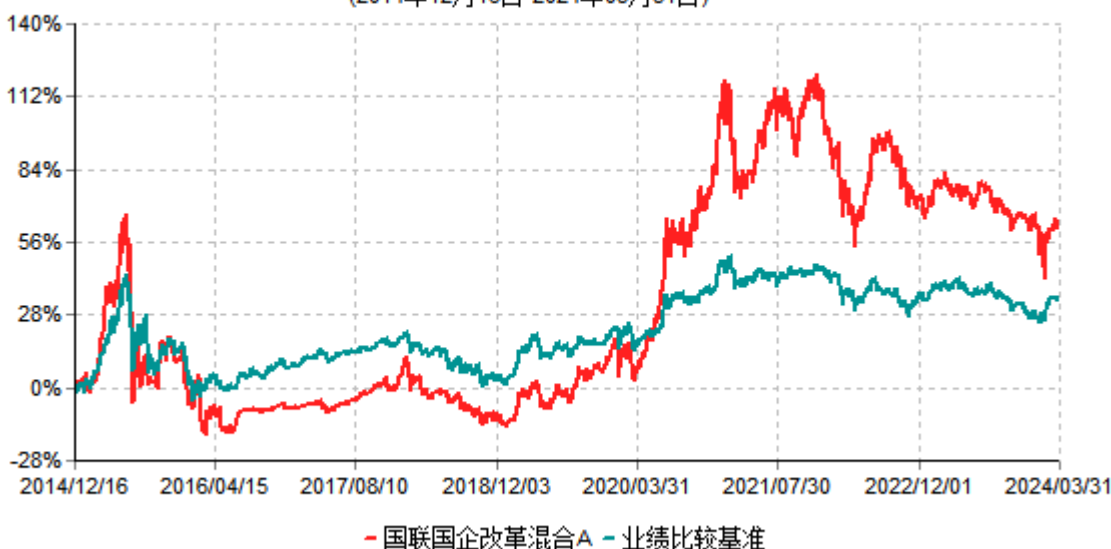
国联国企改革混合A累计净值增长率与业绩比较基准收益率历史走势对比图 (2014年12月16日-2024年03月31日)