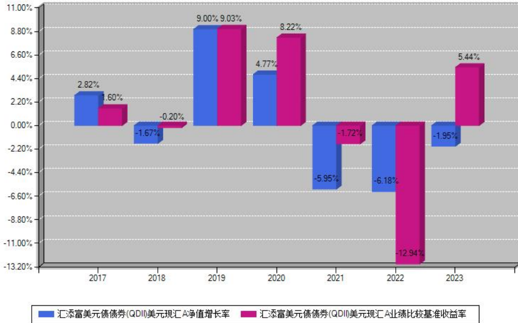
汇添富美元债债券(QDII)美元现汇A每年净值增长率与同期业绩基准收益率对比图

注：基金的过往业绩不代表未来表现。本《基金合同》生效之日为2017年04月20日，合同生效当年按实际存续期计算，不按整个自然年度进行折算。