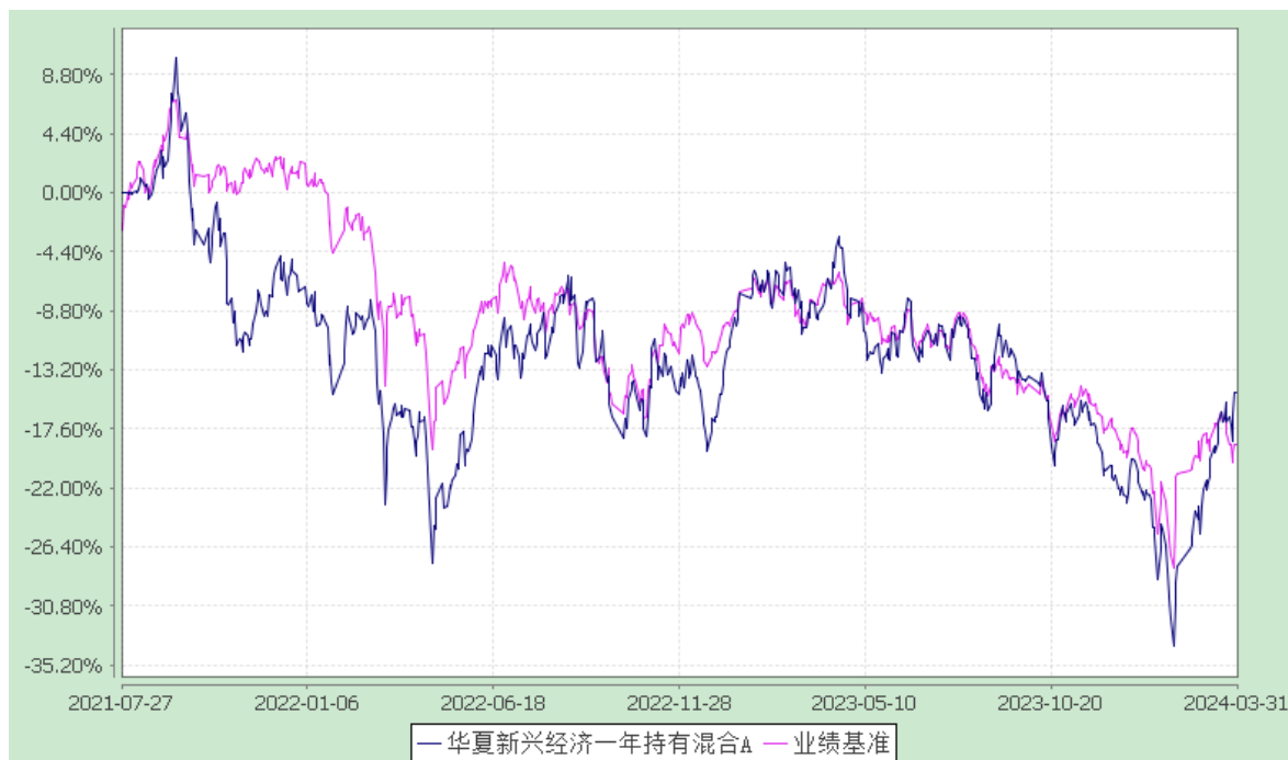
华夏新经济一年持有混合 C: