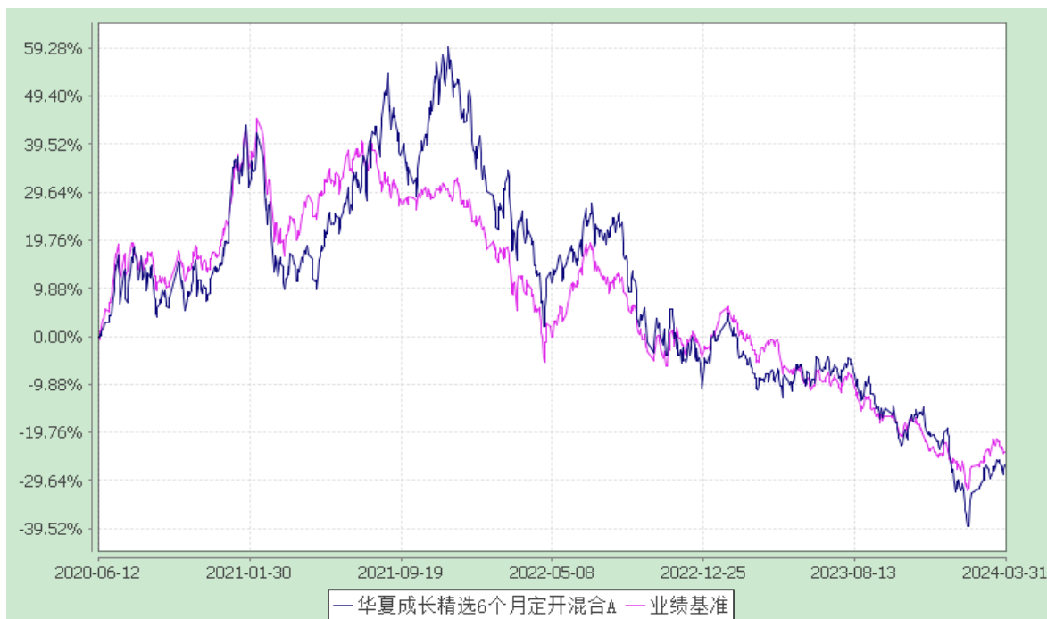
华夏成长精选 6 个月定开混合 C: