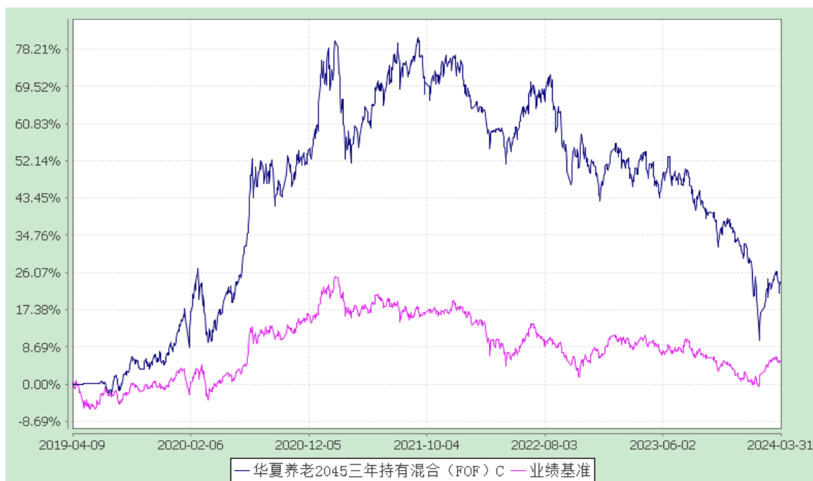
华夏养老 2045 三年持有混合（FOF）Y: