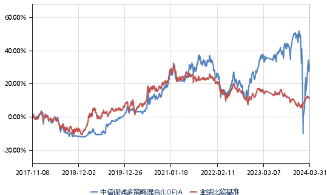
中信保诚多策略混合(LOF)C