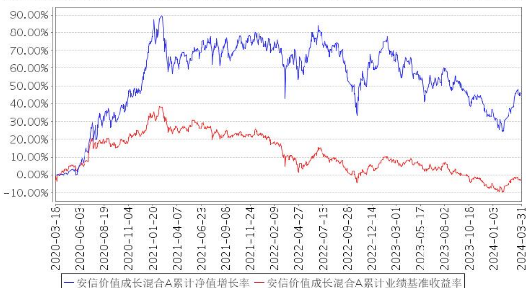
安信价值成长混合A累计净值增长率与同期业绩比较基准收益率的历史走势对比图