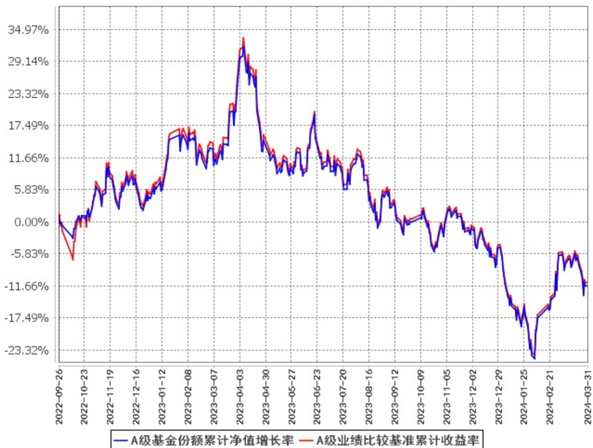
A级基金份额累计净值增长率与同期业绩比较基准收益率的历史走势对比图 (2022年9月26日至2024年3月31日)