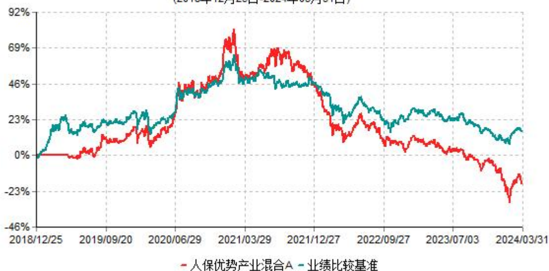
人保优势产业混合A累计净值增长率与业绩比较基准收益率历史走势对比图 (2018年12月25日-2024年03月31日)