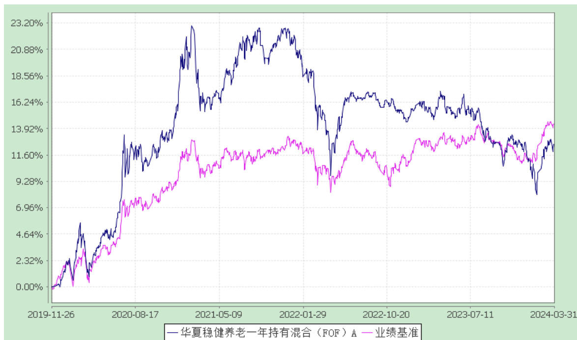
华夏稳健养老一年持有混合（FOF）Y: