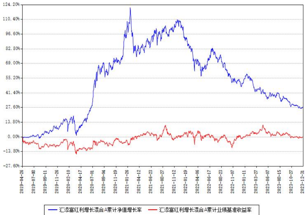
汇添富红利增长混合A累计净值增长率与同期业绩基准收益率对比图

(二) 自基金合同生效以来基金累计净值增长率变动及其与同期业绩比较基准收益率变动的比较图