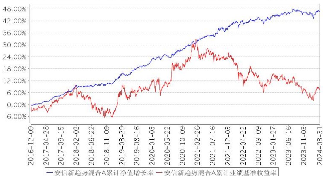
安信新趋势混合A累计净值增长率与同期业绩比较基准收益率的历史走势对比图