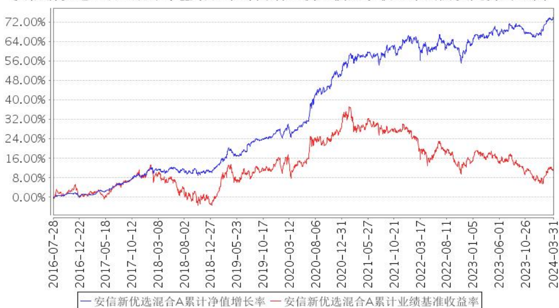
安信新优选混合A累计净值增长率与同期业绩比较基准收益率的历史走势对比图