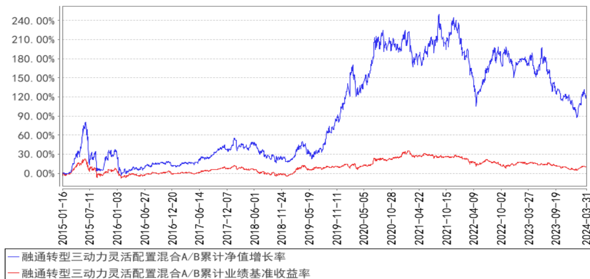
融通转型三动力灵活配置混合A/B累计净值增长率与同期业绩比较基准收益率的历史走势对比图