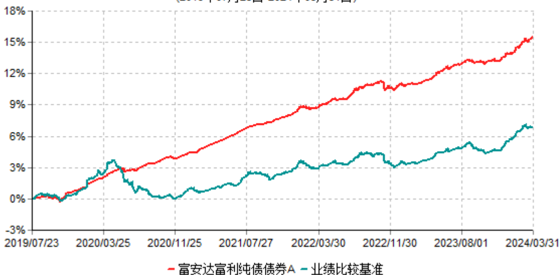
富安达富利纯债债券A累计净值增长率与业绩比较基准收益率历史走势对比图 (2019年07月23日-2024年03月31日)