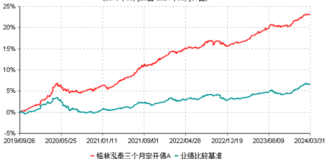
格林泓泰三个月定开债A累计净值增长率与业绩比较基准收益率历史走势对比图 (2019年09月26日-2024年03月31日)