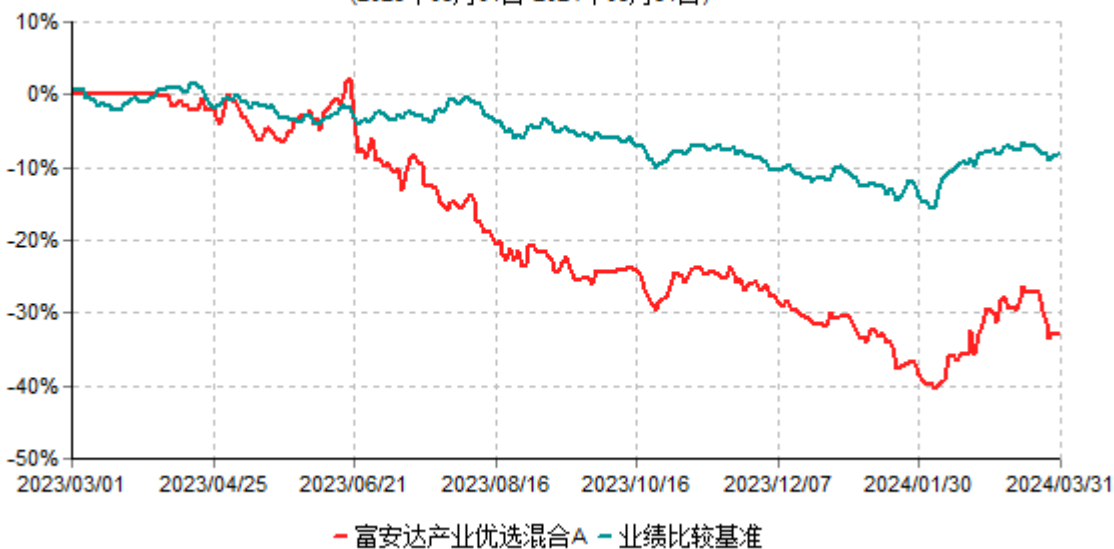
富安达产业优选混合A累计净值增长率与业绩比较基准收益率历史走势对比图 (2023年03月01日-2024年03月31日)