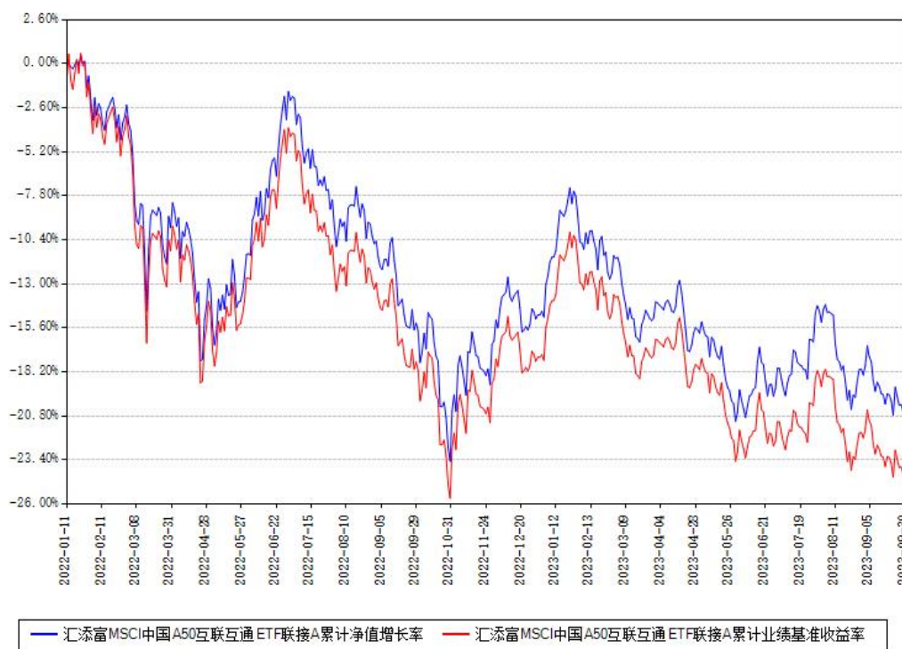
汇添富MSCI中国A50互联互通ETF联接A累计净值增长率与同期业绩基准收益率对比图