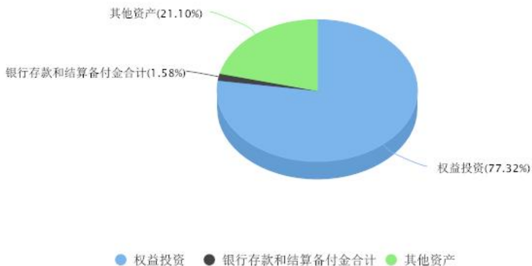
投资组合资产配置图表 数据截止日期:2023年06月30日