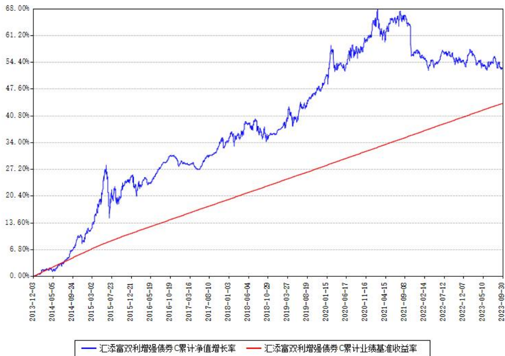
汇添富双利增强债券C累计净值增长率与同期业绩基准收益率对比图