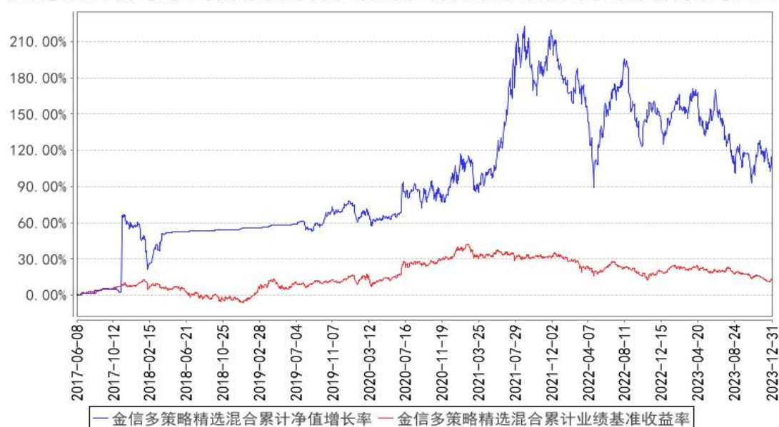
金信多策略精选混合累计净值增长率与同期业绩比较基准收益率的历史走势对比图