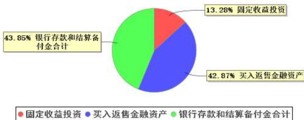
投资组合资产配置图表(2023年12月31日)