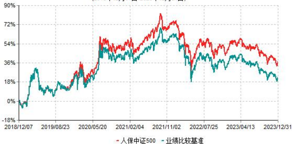
人保中证500指数型证券投资基金累计净值增长率与业绩比较基准收益率历史走势对比图 (2018年12月07日-2023年12月31日)

注：1、本基金基金合同于2018年12月7日生效。根据基金合同规定，本基金建仓期为6个月，建仓期结束，本基金的各项投资比例符合基金合同的有关约定。