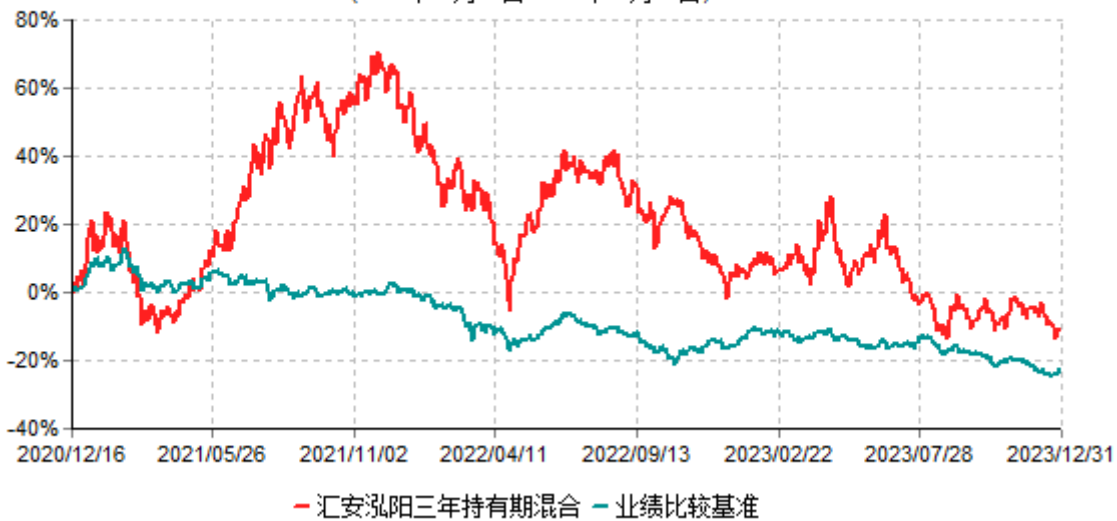
汇安泓阳三年持有期混合型证券投资基金累计净值增长率与业绩比较基准收益率历史走势对比图 (2020年12月16日-2023年12月31日)