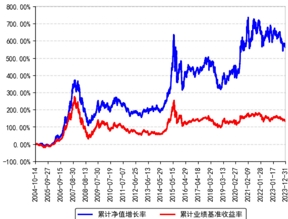
南方积极配置混合（LOF）累计净值增长率与同期业绩比较基准收益率的历史走势对比图