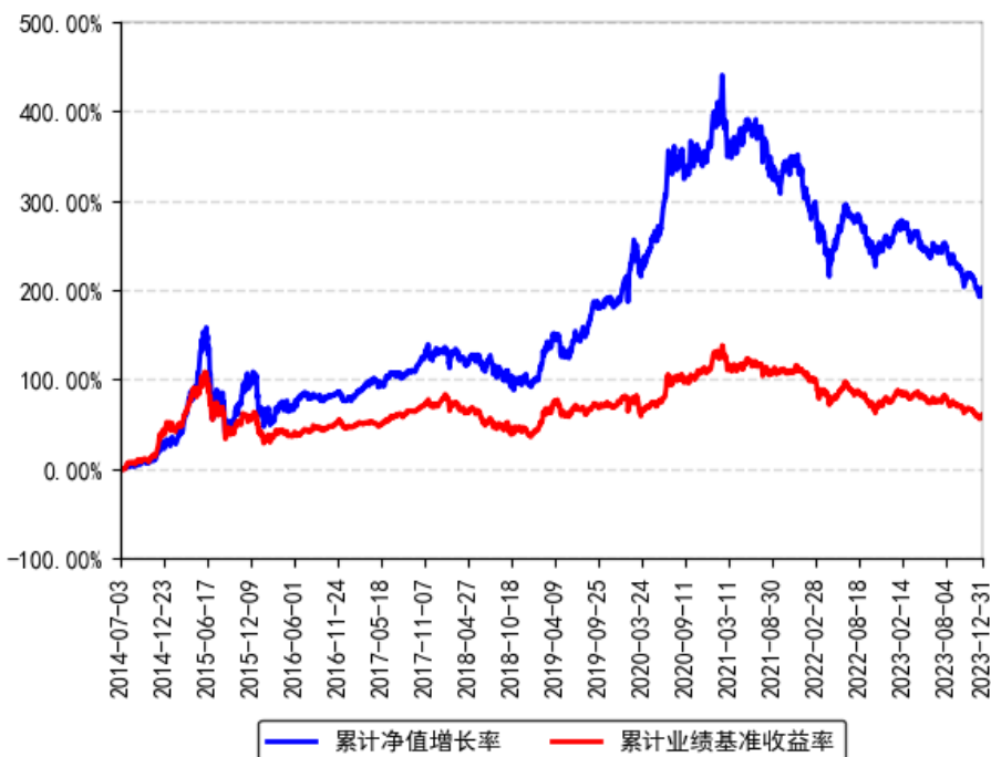
南方天元新产业股票（LOF）累计净值增长率与同期业绩比较基准收益率的历史走势对比图