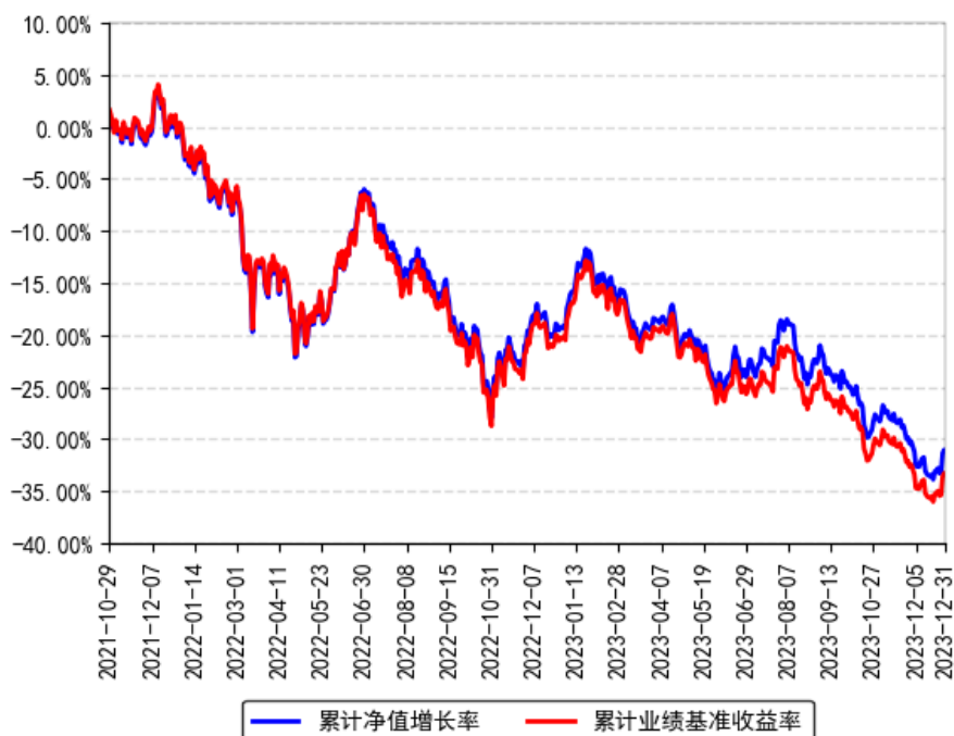
南方MSCI中国A50互联互通ETF累计净值增长率与同期业绩比较基准收益率的历史走势对比图