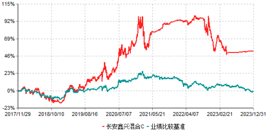
长安鑫兴混合C累计净值增长率与业绩比较基准收益率历史走势对比图 (2017年11月29日-2023年12月31日)

根据基金合同的规定,自基金合同生效之日起6个月内基金各项资产配置比例需符合基金合同要求。截止到建仓期结束时,本基金的各项投资组合比例已符合基金合同的相关规定。基金合同生效日至报告期期末,本基金运作时间已满一年。图示日期为2017年11月29日至2023年12月31日。