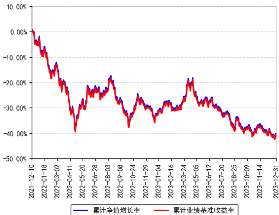
南方上证科创板50成份ETF累计净值增长率与同期业绩比较基准收益率的历史走势对比图