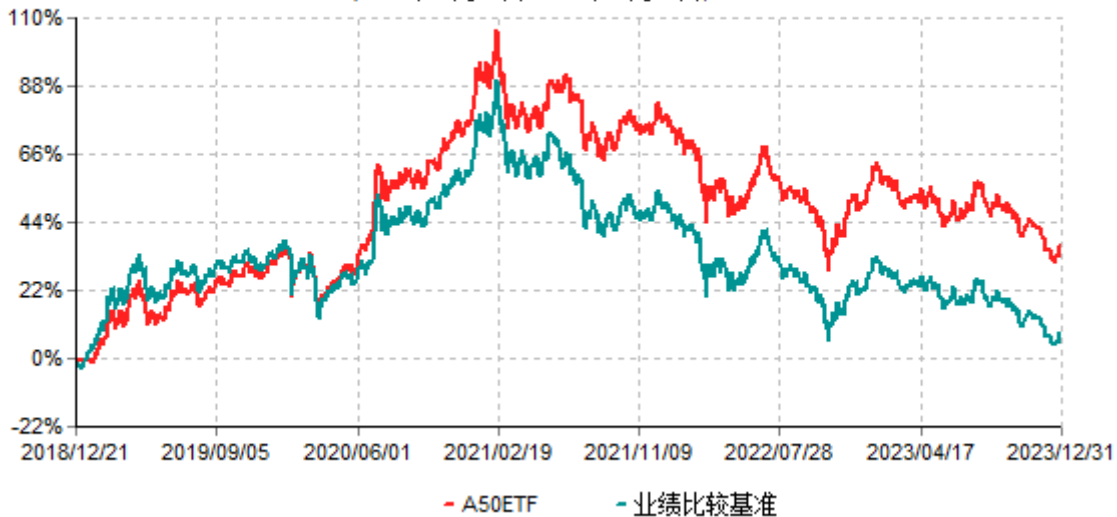
富时中国A50交易型开放式指数证券投资基金累计净值增长率与业绩比较基准收益率历史走势对比图 (2018年12月21日-2023年12月31日)