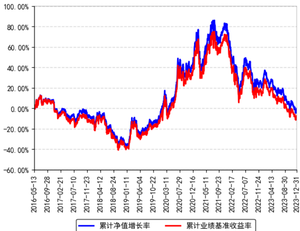
南方创业板ETF累计净值增长率与同期业绩比较基准收益率的历史走势对比图