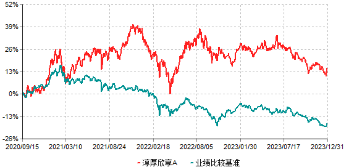
淳厚欣享A累计净值增长率与业绩比较基准收益率历史走势对比图 (2020年09月15日-2023年12月31日)

注：本基金基金合同生效日为2020年9月15日。按基金合同规定，本基金自基金合同生效起6个月内为建仓期。建仓期结束时本基金的各项投资比例均符合基金合同约定。