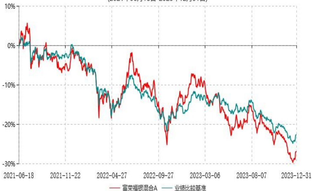
富荣福银混合C累计净值增长率与业绩比较基准收益率历史走势对比图