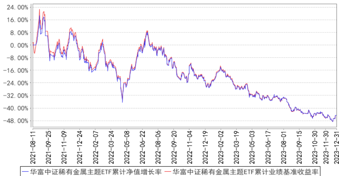
华富中证稀有金属主题ETF累计净值增长率与同期业绩比较基准收益率的历史走势对比图

注：本基金建仓期为2021年8月11日到2022年2月11日，建仓期结束时各项资产配置比例符