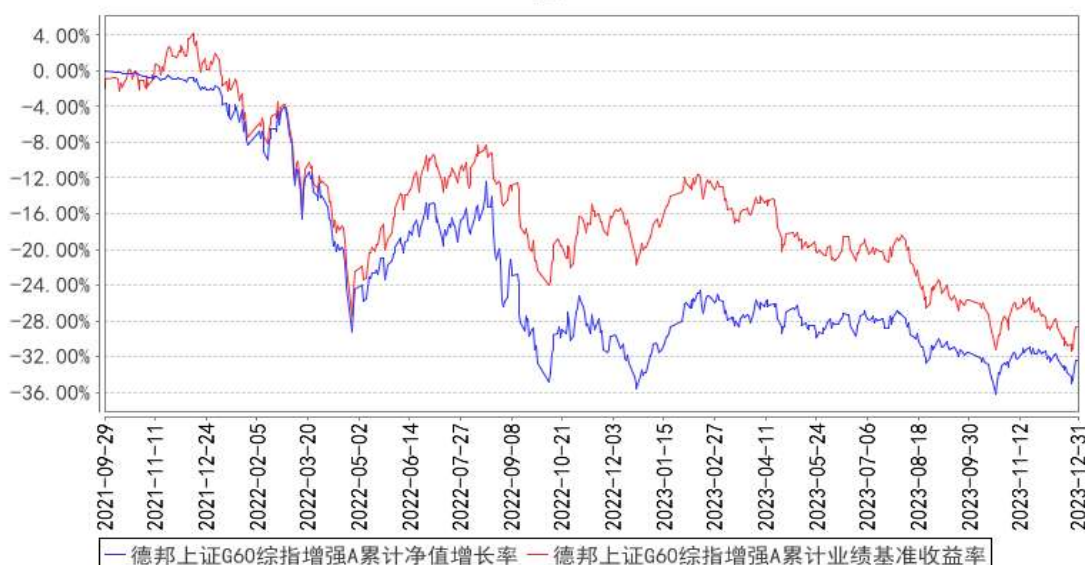
德邦上证G60综指增强A累计净值增长率与同期业绩比较基准收益率的历史走势对比图