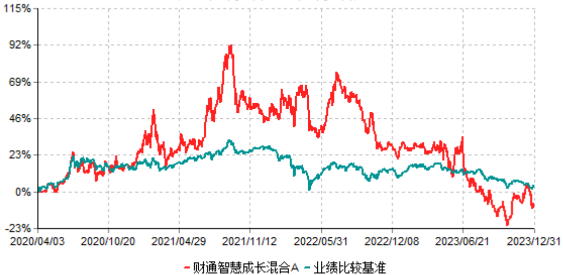
财通智慧成长混合A累计净值增长率与业绩比较基准收益率历史走势对比图 (2020年04月03日-2023年12月31日)