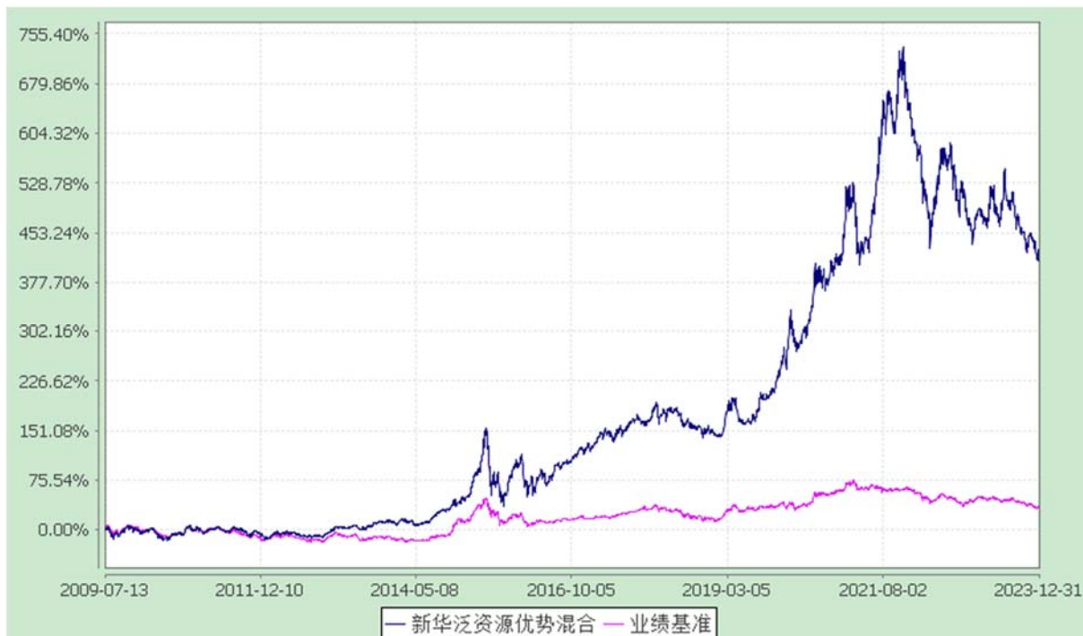
自基金合同生效以来份额累计净值增长率与业绩比较基准收益率的历史走势对比图 (2009 年 7 月 13 日至 2023 年 12 月 31 日)