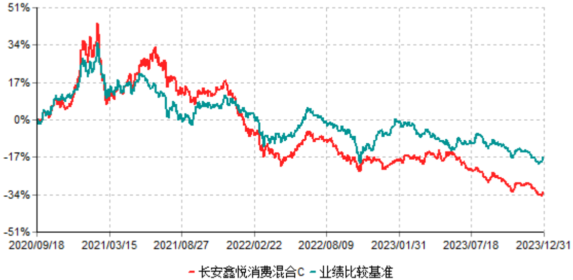
长安鑫悦消费混合C累计净值增长率与业绩比较基准收益率历史走势对比图 (2020年09月18日-2023年12月31日)

根据基金合同的规定,自基金合同生效之日起6个月内基金各项资产配置比例需符合基金合同要求。本基金在建仓期结束后,各项资产配置比例已符合基金合同有关投资比例的约定。本基金于2020年09月18日成立,基金合同生效日至报告期末,本基金运作时间已满一年。图示日期为2020年09月18日至2023年12月31日止。