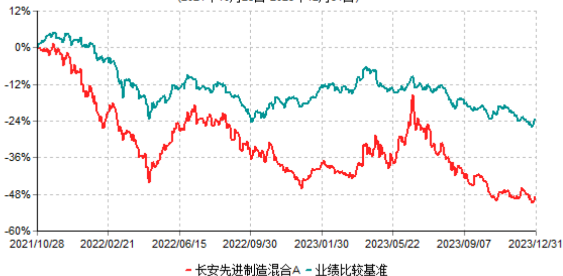
长安先进制造混合A累计净值增长率与业绩比较基准收益率历史走势对比图 (2021年10月28日-2023年12月31日)

根据基金合同的规定,自基金合同生效之日起6个月内基金各项资产配置比例需符合基金合同要求。本基金在建仓期结束后,各项资产配置比例已符合基金合同有关投资比例的约定。基金合同生效日至报告期期末,本基金运作时间超过一年。图示日期为2021年10月28日至2023年12月31日。