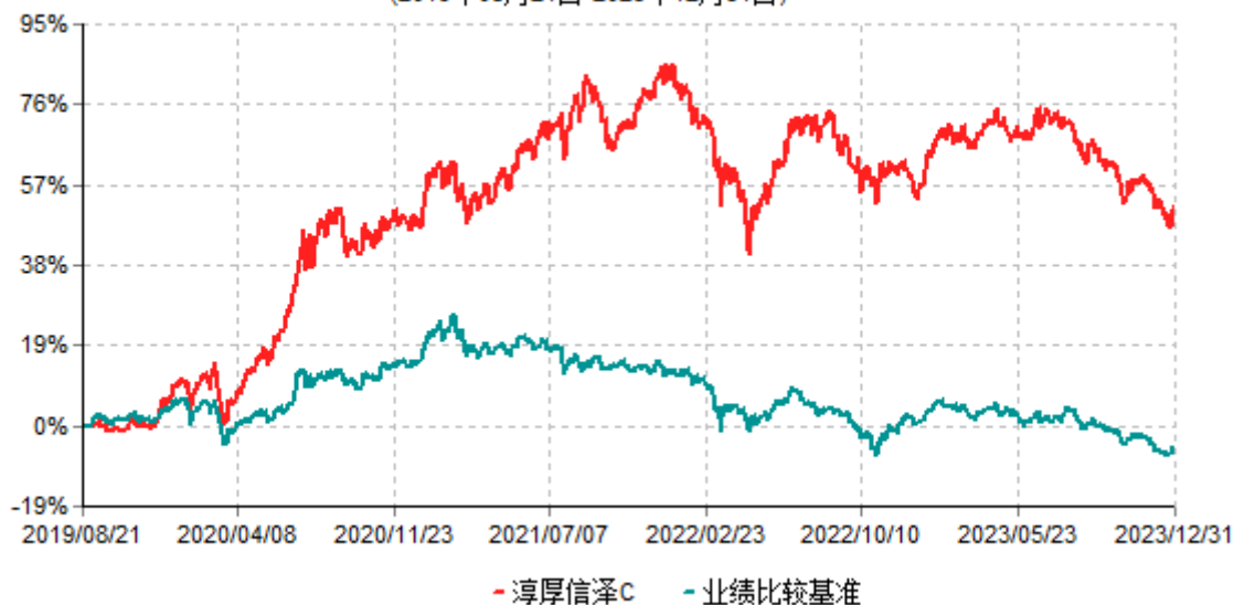
淳厚信泽C累计净值增长率与业绩比较基准收益率历史走势对比图 (2019年08月21日-2023年12月31日)

注：本基金基金合同生效日为2019年8月21日。按基金合同约定，本基金自基金合同生效起6个月内为建仓期。建仓期结束时本基金的各项投资比例均符合基金合同约定。