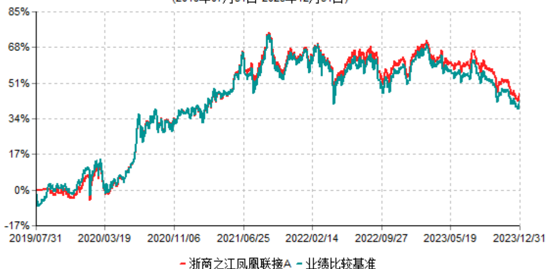
浙商之江凤凰联接A累计净值增长率与业绩比较基准收益率历史走势对比图 (2019年07月31日-2023年12月31日)