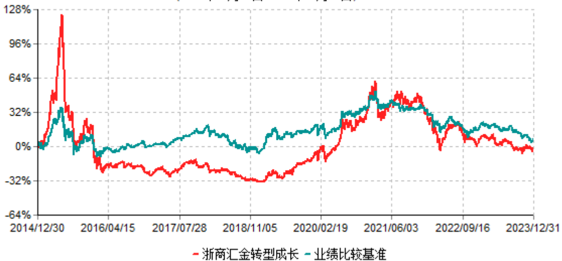
浙商汇金转型成长混合型证券投资基金累计净值增长率与业绩比较基准收益率历史走势对比图 (2014年12月30日-2023年12月31日)