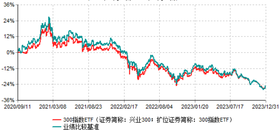
兴业沪深300交易型开放式指数证券投资基金累计净值增长率与业绩比较基准收益率历史走势对比图 (2020年09月11日-2023年12月31日)