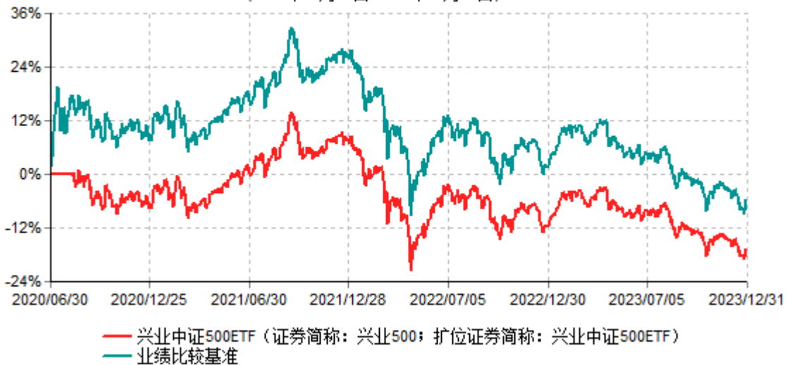
兴业中证500交易型开放式指数证券投资基金累计净值增长率与业绩比较基准收益率历史走势对比图 (2020年06月30日-2023年12月31日)