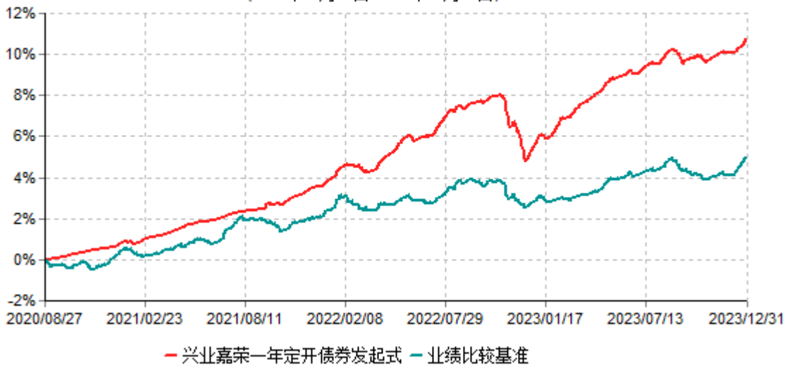
兴业嘉荣一年定期开放债券型发起式证券投资基金累计净值增长率与业绩比较基准收益率历史走势对比图 (2020年08月27日-2023年12月31日)

注：根据本基金基金合同规定，基金管理人自基金合同生效之日起6个月内已使基金的投资组合比例符合基金合同的有关规定。