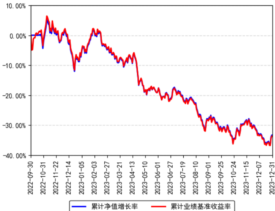
南方上证科创板新材料ETF累计净值增长率与同期业绩比较基准收益率的历史走势对比图