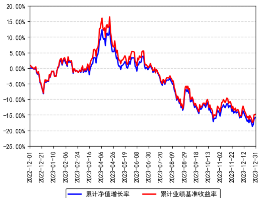
南方上证科创板50成份增强策略ETF累计净值增长率与同期业绩比较基准收益率的历史走势对比图